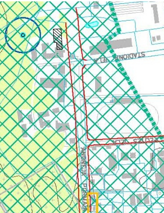
ĢP, AR, BK rasējumu saraksts